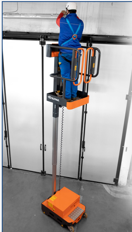
Elevah E5 Move